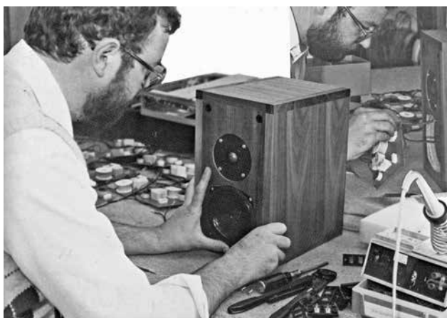
JOHAN KETELAAR VERVAARDIGD JK ACOUSTICS OPTIMA 1