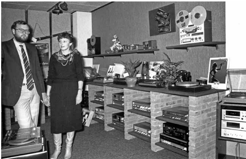
OPENING RADIO KETELAAR 1981