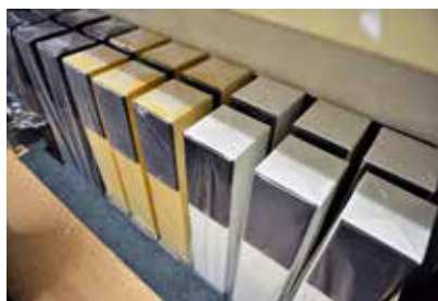
GEPRODUCEERDE JK ACOUSTICS STYLE LUIDSPREKERS