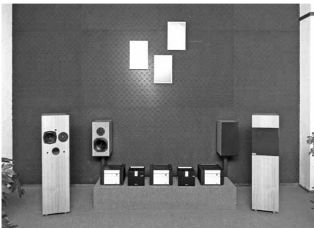
LUISTERRUIMTE RADIO KETELAAR 1986 - JK ACOUSTICS OPTIMA 3