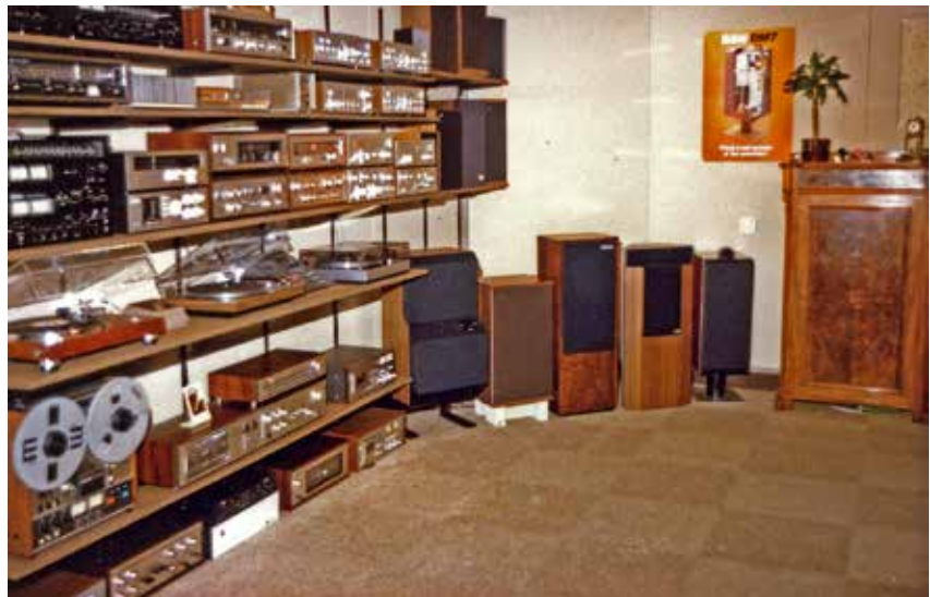
EERSTE WINKEL (GARAGE) RADIO KETELAAR