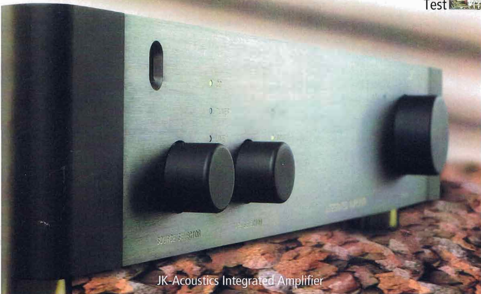
JK-Acoustics Integrated Amplifier